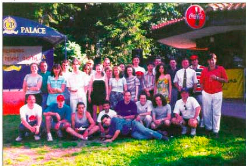
Част от участните в партито

З а четвърти път на 27 юни в дипломатическия клуб в кв. "Горна баня" Ротаракт клуб - София, проведе благотворително тениспарти. Тази инициатива на софийските ротарактори е един от традиционните годишни проекти на клуба.